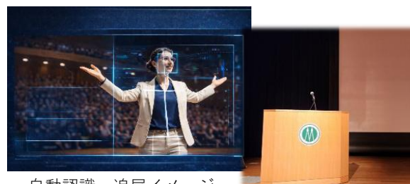
自動認識・追尾イメージ